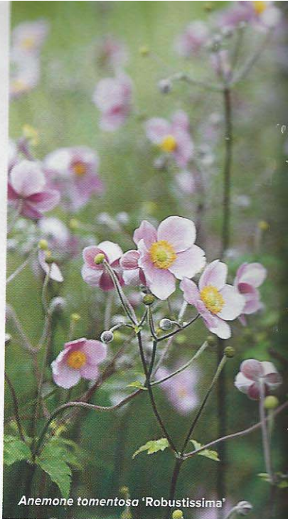
Anemone tomentosa 'Robustissima'

Zachte bloemkleuren dansen van de ene naar de andere border. Vooral blauw- en rozetinten, met hier en daar ook wolken rood, aubergine, oranje en zachtgeel. Typische prairieplanten bloeien hier zij aan zij, zoals soorten Echinacea ,